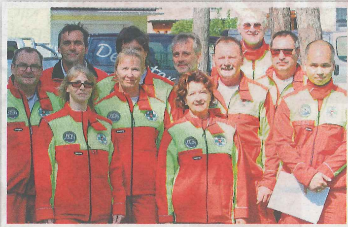
Die ÖHU-Suchhundestaffel zeigte bei einer Vorführung das Können ihrer Hunde. Danach durften die Tiere gestreichelt werden.

Das wirtschaftliche Highlight des Jahres war die Strasshofer Marchfeldmesse, die am Wochenende in Szene ging. Mehr Aussteller als je zu vor waren vertreten. Auch das Rahmenprogramm konnte sich sehen lassen.